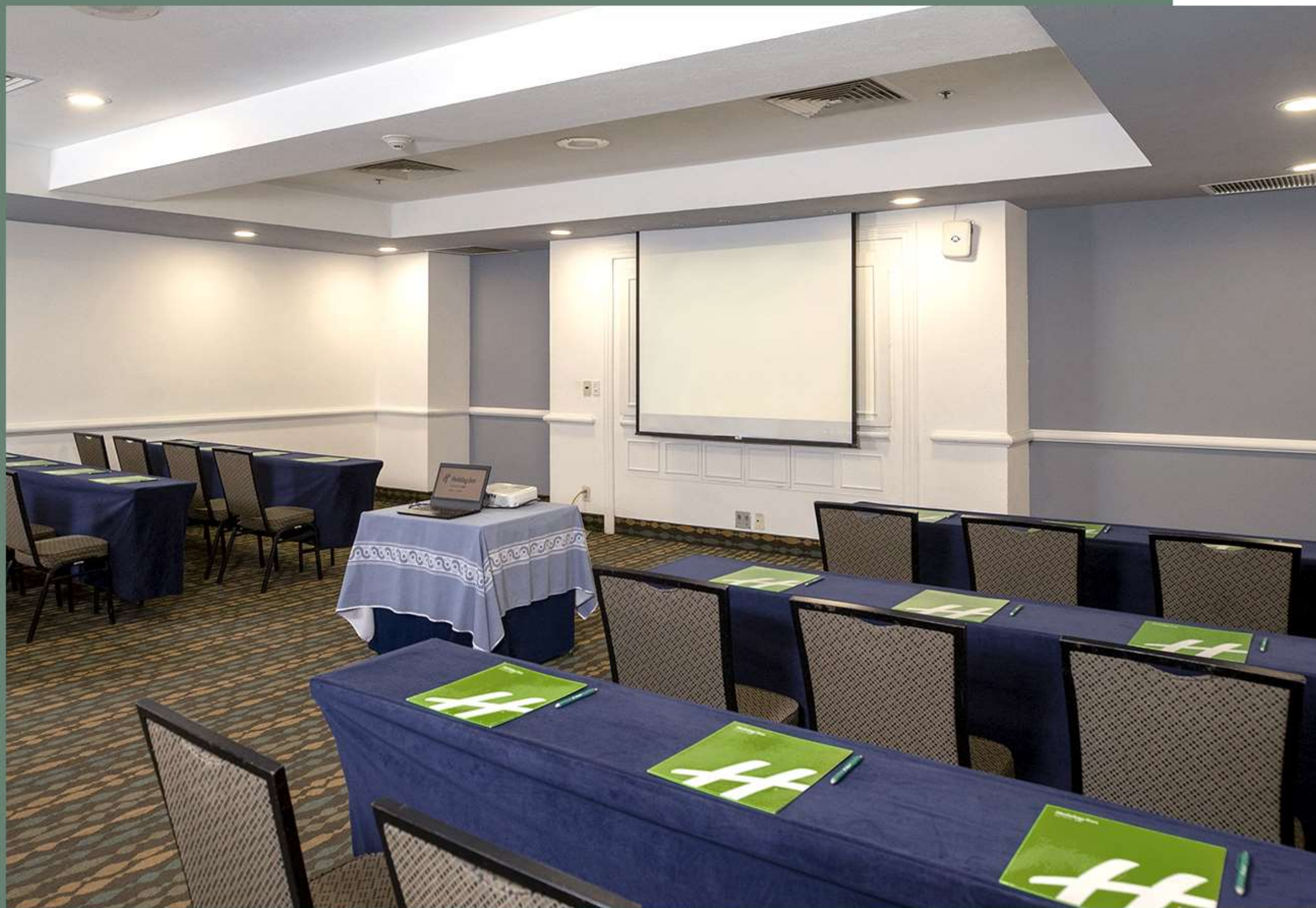
Montaje tipo Escuela